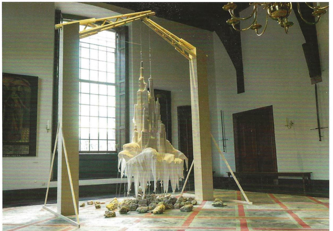
Ontworteling, Textile, wood, Acylic One, cables, rope, stones, Height 450 cm, 2018. Photography Marinus de Beer