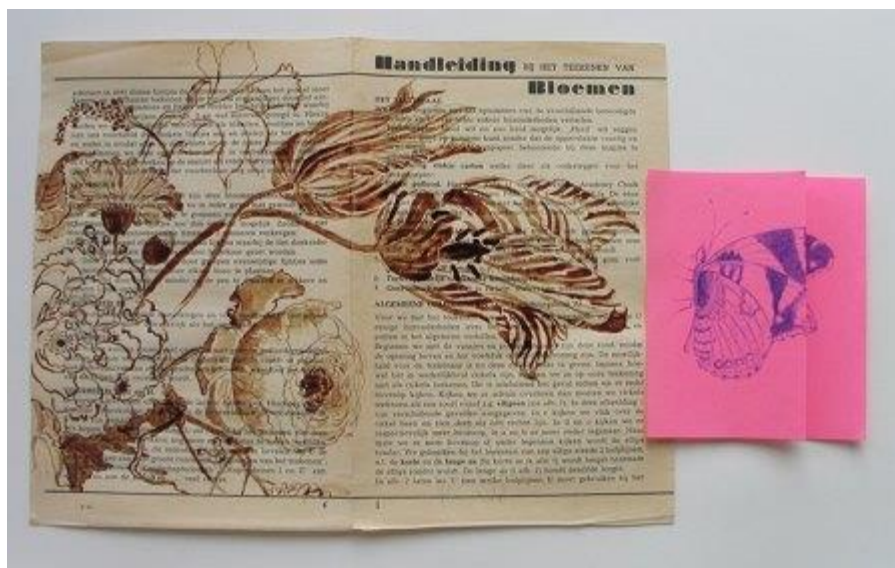
Leonie Mijndliëff, VANITAS MET VLINDER.