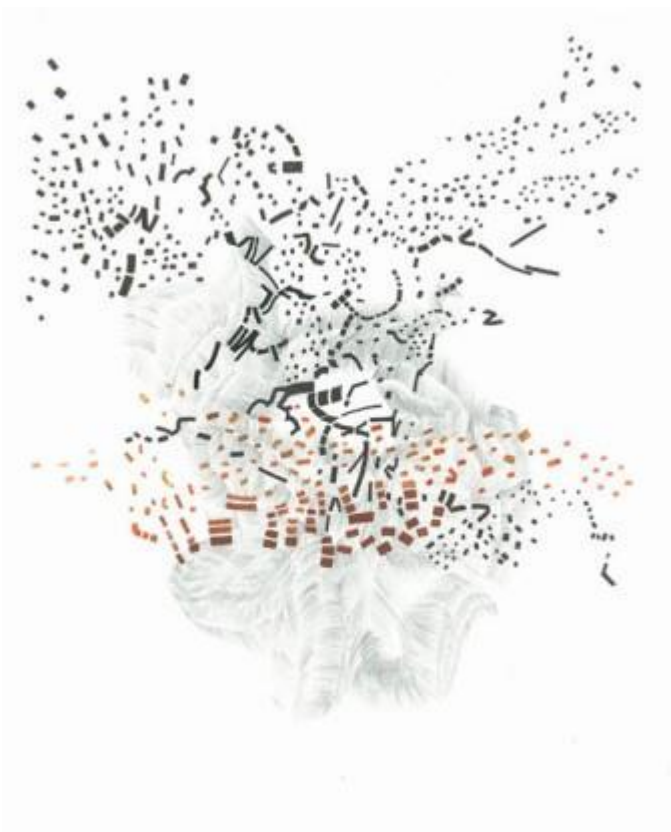
Bernadette Beunk, Z.T.