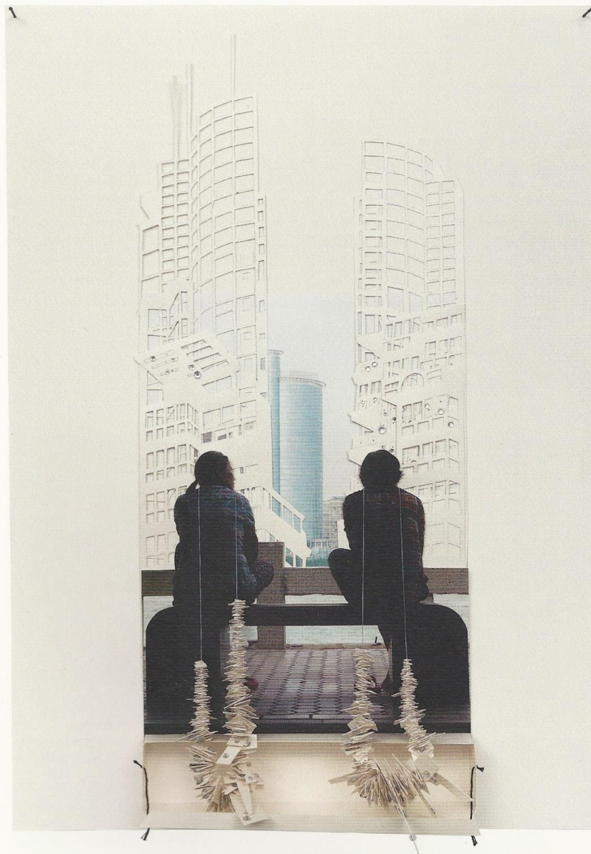
Rechts: Heavy Jewellery. 2012 Diverse technieken op papier en fotografie 54 x 40 x 10 cm