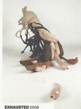
EXHAUSTED 2006 KERAMIEK, TEXTIEL, LATEX EN MOTORFRAME H. CA. 200 CM collectie kunstenaar