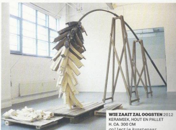
WIE ZAAIT ZAL OOGSTEN 2012 KERAMIEK, HOUT EN PALLET H. CA. 300 CM collectie kunstenaar