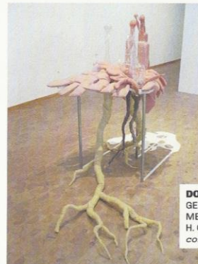
DOMESTICITY 2009 GEBLAZEN GLAS, TEXTIEL, METAAL EN HOUT H. CA. 200 CM collectie kunstenaar