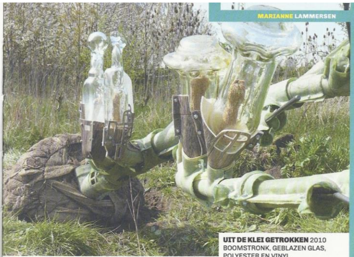
UIT DE KLEI GETROKKEN 2010 BOOMSTRONK, GEBLAZEN GLAS, POLYESTER EN VINYL H. CA. 100 CM collectie kunstenaar