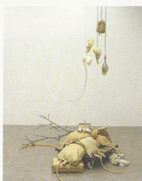
INFUSION 2008 MORTEL, KIEZEL, KERAMIEK, TEXTIEL, GEBLAZEN GLAS, TAKKEN EN PALET H. CA. 200 CM collectie kunstenaar