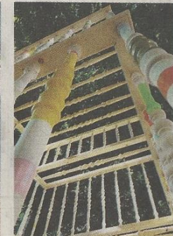
Occupied space - Frode Bolhuis