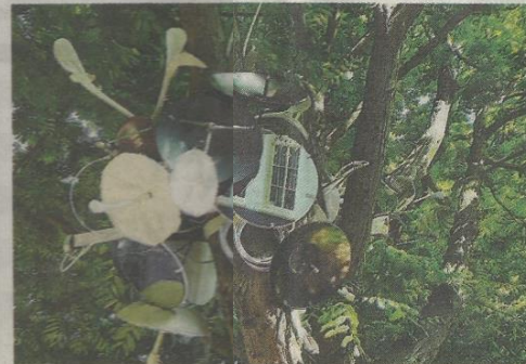
Parasiet - Marianne Lammers