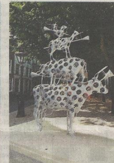
Zonder titel - Guido Geelen