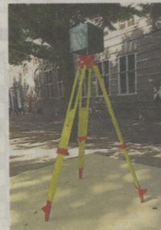
Morning sky - Lotte Geeven