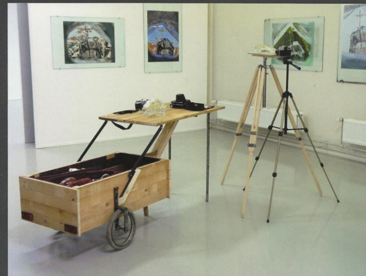
Opstelling 'Through my looking glass' • 2010 • Geblazen glas, vlakglas, fotocamera, hout, foto's